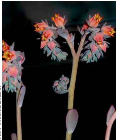
FOTO 4. Inflorescencia de Echeveria guerrensis .

Se estudiaron las estructuras florales de manera exhaustiva y después de la revisión bibliográfica, se llegó a la conclusión de que