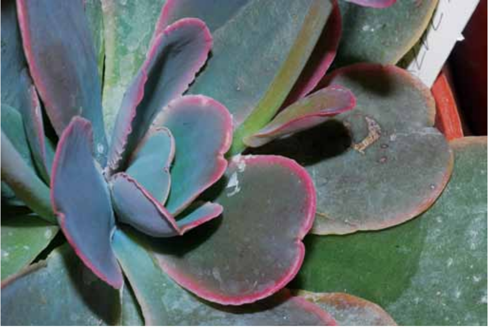
FOTO 1. Detalle de las hojas obcordadas de Echeveria guerrerensis de color verde azuloso y bordes rosados.