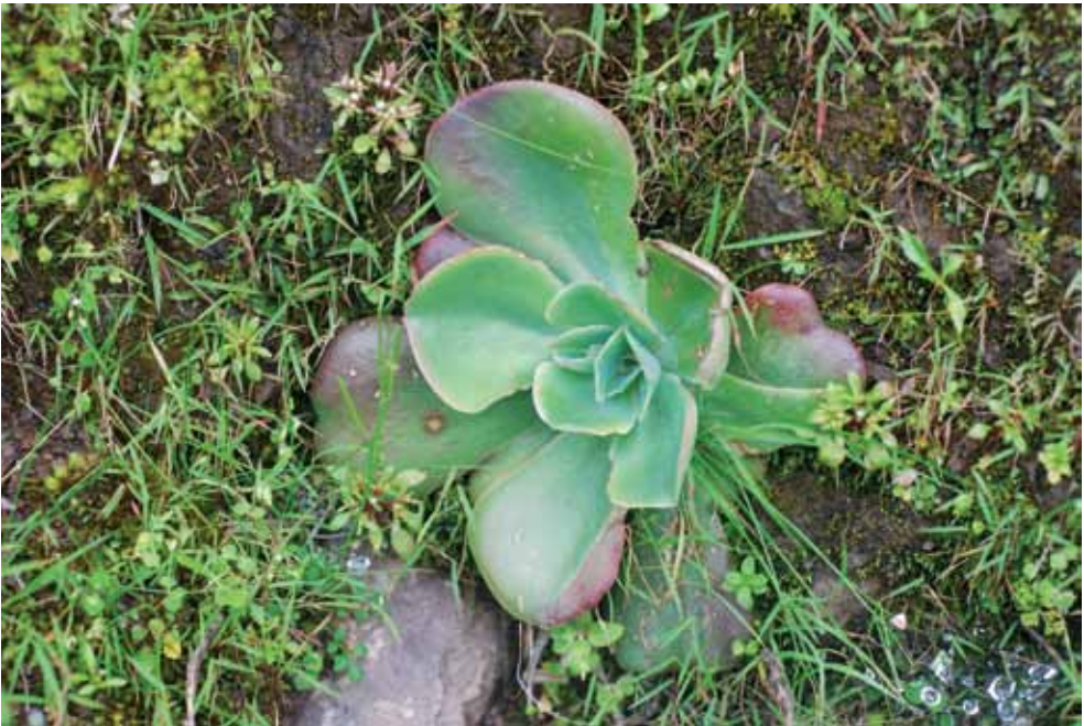
FOTO 2. Echeveria guerrerensis creciendo en hábitat en la localidad de Toro Muerto, Guerrero.