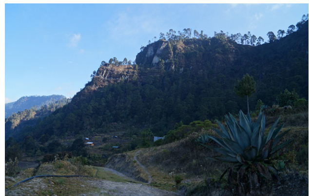
Figura 5. Hábitat de Echeveria andreae J. Reyes y L.E. Cruz-López, en bosque de Pinus-Quercus de la localidad tipo.

Facultad de Arquitectura de la Universidad Nacional Autónoma de México, quien ubicó por primera ocasión la localidad tipo de la nueva especie y por su interés en el rescate y conservación de plantas, especialmente de Chiranthodendron pentadactylon Larreat., y de las especies utilizadas en los jardines prehispánicos.