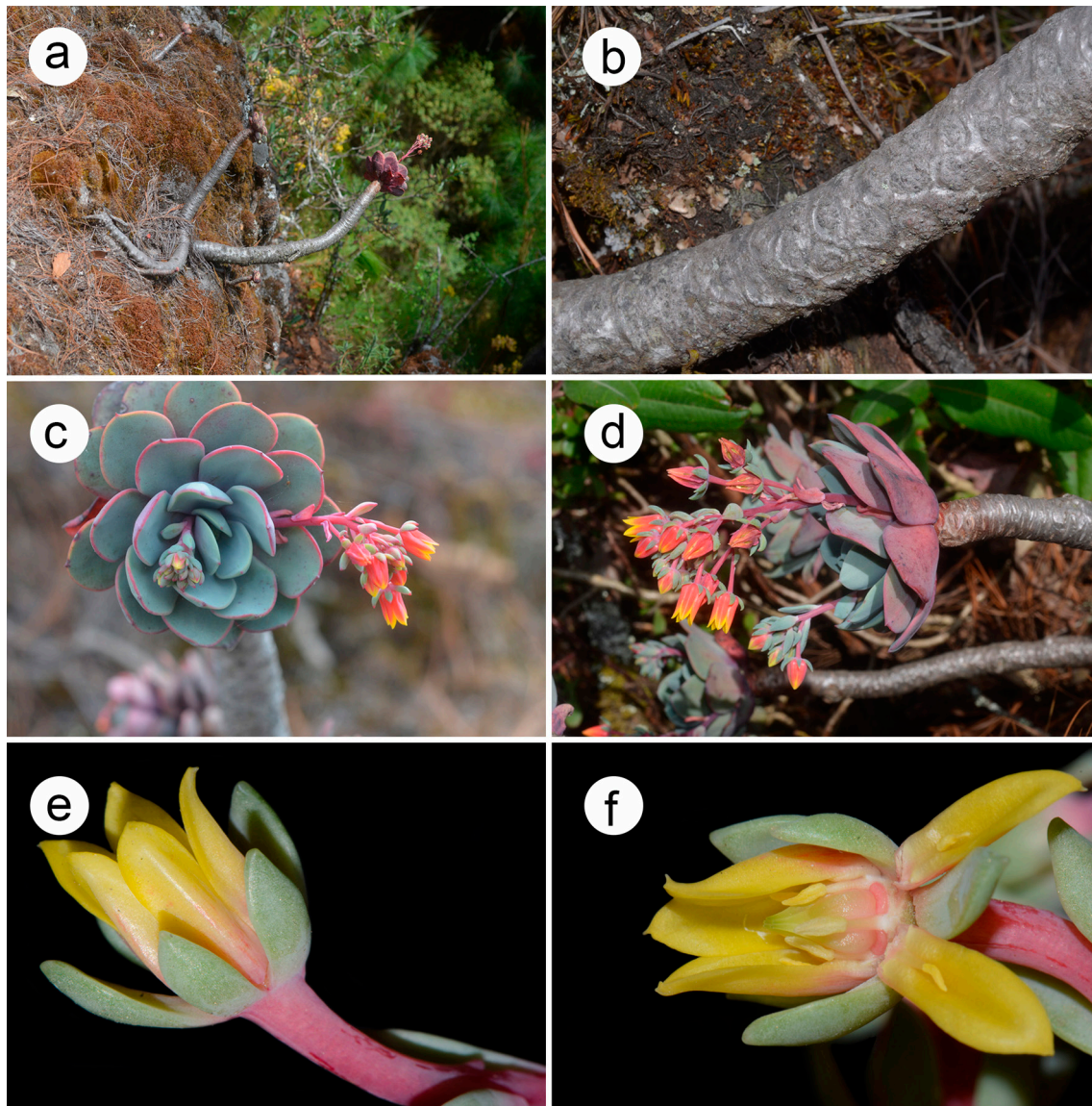
Figura 2. Echeveria andreae J. Reyes y L.E. Cruz-López. a-b) Hábito y tallo, en su hábitat, c) roseta, d) inflorescencias, e) vista lateral de la corola; f) detalle de los verticilos florales.

incluyendo la inflorescencia, 2-5 mm de grueso cerca de la base con hojas obovadas a oblanceoladas, ascendentes, pronto caedizas, 1.5-2.5 cm de longitud, 0.5-1.5 cm de ancho, glaucas, algo pruinosas, a veces rojizas, ápice mucronado. Inflorescencia racemosa, 7-16 flores, 3-8 cm de largo, bractéolas obovadas a lanceoladas, 0.4-1 cm de largo, 1-5 mm de ancho, glaucas, margen rojizo, ápice agudo. Pedicelos rojizos 1.5-7 cm de largo, 0.8-2 mm de grueso. Cáliz de 5 sépalos, basalmente fusionados, lóbulos lanceolados, desiguales entre sí, 4-9 mm de largo, 1.5-